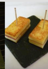
Mini club jambon