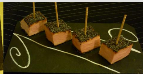
Noix de jambon cuit en basse température pané au balsamique et sésame.