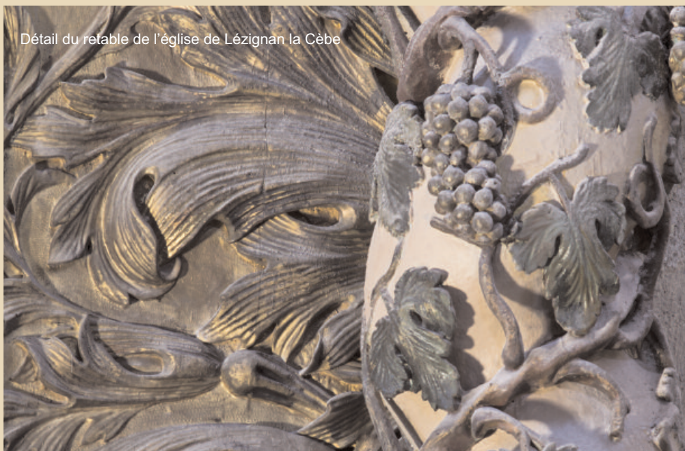
Détail du retable de l'église de Lézignan la Cèbe

Un grand Merci aux municipalités, aux associations, et à tous ceux qui ont contribué à faire ce programme d'animations